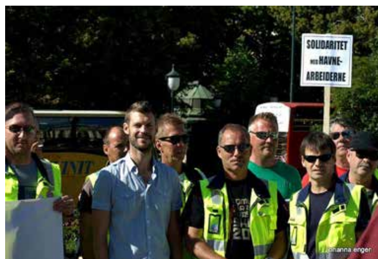
Rødts leder, Bjørnar Moxnes, i demonstrasjon sammen med havnearbeidere som sloss for tariffavtale.

I kommunestyret på Nesodden er det usedvanlig lite forståelse for faglige rettigheter. Få av kommunestyre-medlemmene har hatt en jobb på “gølvet”.