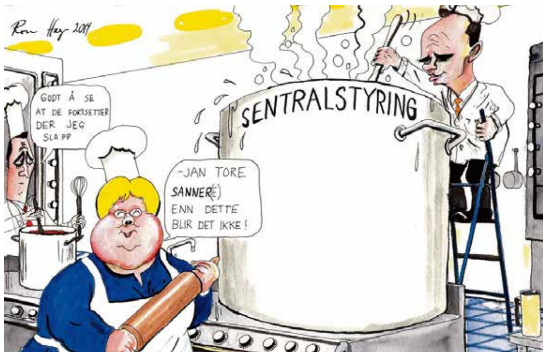
Tegning: Roar Hagen, VG

Det påstås at vi har for små og lite "robuste" kommuner. Men en rekke undersøkelser viser at folk er mer fornøyd med tjenestetilbudene i mindre kommuner, og at det også gjør det lettere for innbyggerne å påvirke. Nærhet til sakene gjør at folk engasjerer seg mer.