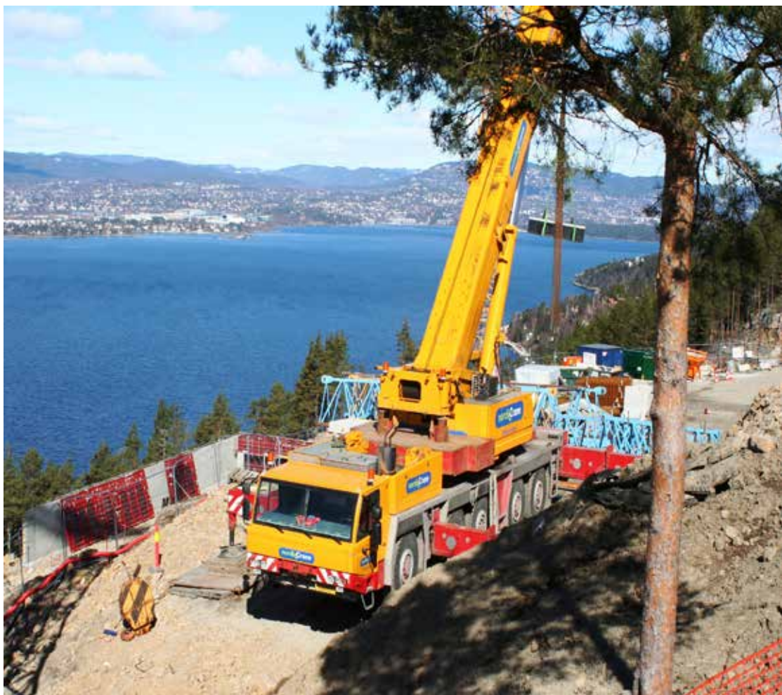
Utbygginger, slik som på Varden, blir unødige dyre

Det bygges for få og for dyre boliger i Norge. Spekulantene klager på tomtangel, tungvinte reguleringsbestemmelser og kommunalt sommel. De bløffer Det er «det ufrie markedet» - spekulantene selv - som sørger for få og dyre boliger.