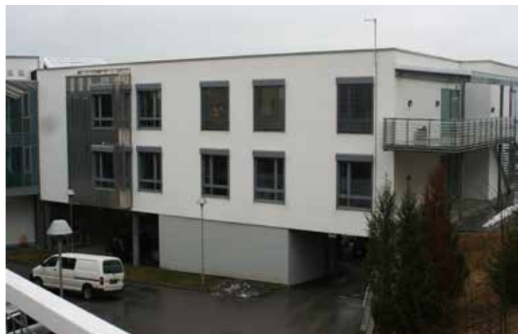
Nesoddtunet har plass til legevakt og vil nyte godt av samarbeid med legevakten

Motstandere av døgnlegevakt i AP og Høyre tyr til ufine triks for å skremme velgerne: