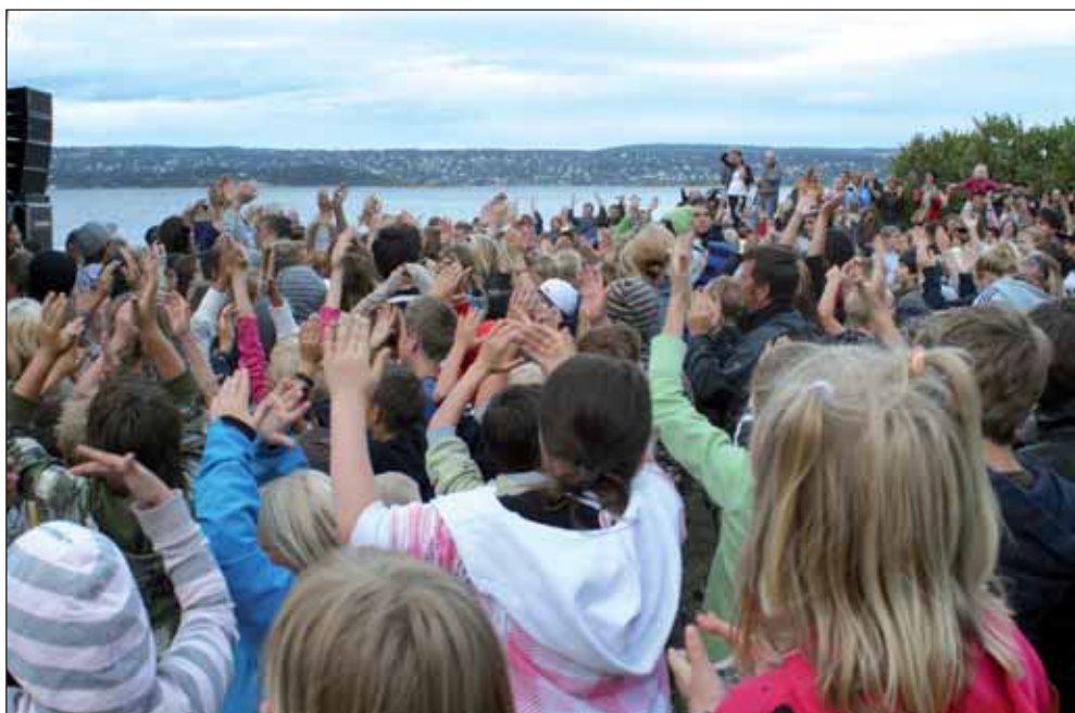
Kulturisten på Hellviktangen i 2008 trakk masse folk.